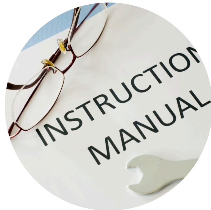
面接マニュアル整備